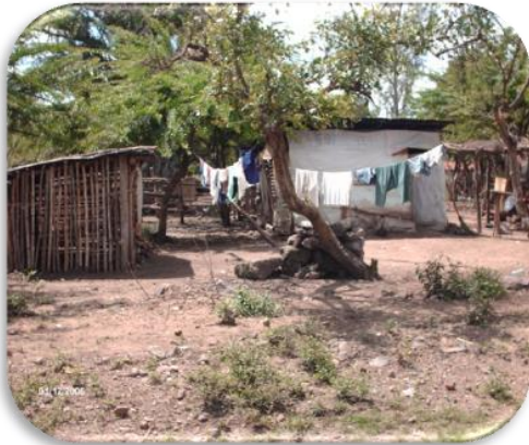
Casa y patio de la vivienda de la comunidad