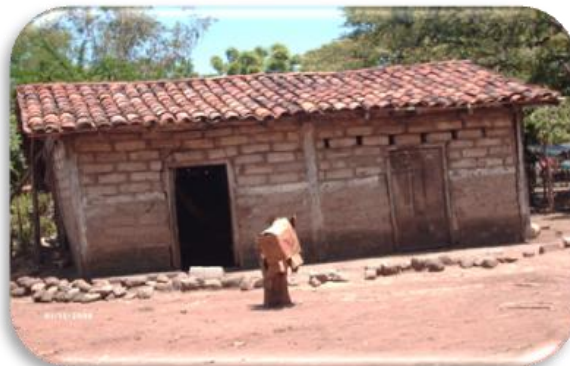
Estado físico de una casa de la comunidad