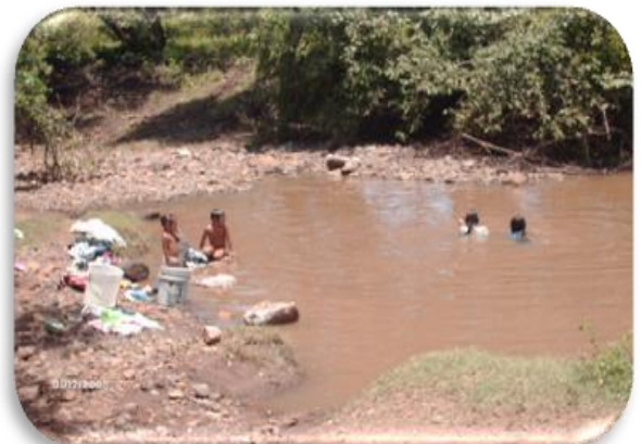
Niños bañándose en la Quebrada La Lapa