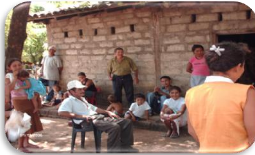
Pobladores de la Comunidad